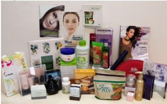
VALLADOLID, 1 (EUROPA PRESS)

Las empresas de venta directa facturaron en Castilla y León en 2010 más de 29 millones de euros Las empresas de venta directa facturaron en Castilla y León en 2010 un total de 29.270.008 euros, mientras que en el ámbito nacional el sector obtuvo unas ventas de 512.299.348 euros. 1 de junio de 2011