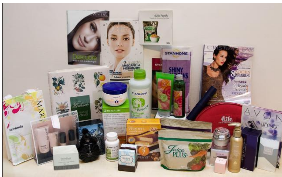
El sector de la venta directa mejora y los resultados de 2010 lo confirman. Castilla La Mancha, una de las comunidades que ha conseguido mantener sus cifras en 2010, facturó 26.337.196 euros, mientras que a nivel nacional, el sector ha obtenido unas ventas de 512.299.348 euros, según la Asociación de Venta Directa (AVD).