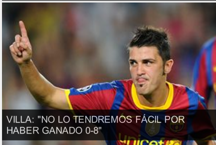
VILLA: "NO LO TENDREMOS FÁCIL POR HABER GANADO 0-8"