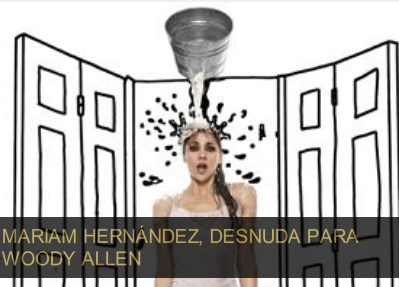
MARIAM HERNÁNDEZ, DESNUDA PARA WOODY ALLEN