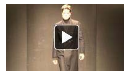
Menswear Fashion Show Autumn/Winter 2011/12 from Franck Boclet