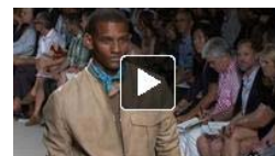
Your perfect leathers!