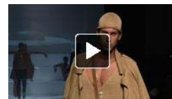
Dare to wear the colours of the desert this summer!