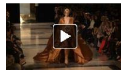
Haute Couture Fashion Show Spring/Summer 2011 from Stéphane Rolland with an exclusive interview