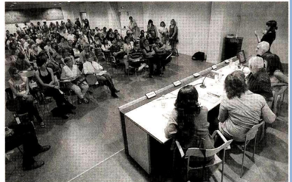
La conferencia de L'Heura registró un lleno absoluto en la Biblioteca Central. NEBRIDI ARÓZTEGUI

En el transcurso de las presentaciones, los participantes hicieron un recorrido por sus vivencias, desde que detectaron las anomalías en sus hijos pequeños hasta conocer cuál era su patología. También hablaron de cómo afrontaron el diagnóstico y como sacudió la noticia en la pareja y también en los hermanos, si los había,